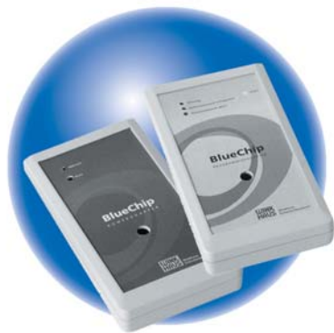
Poweradapter und Programmiergerät